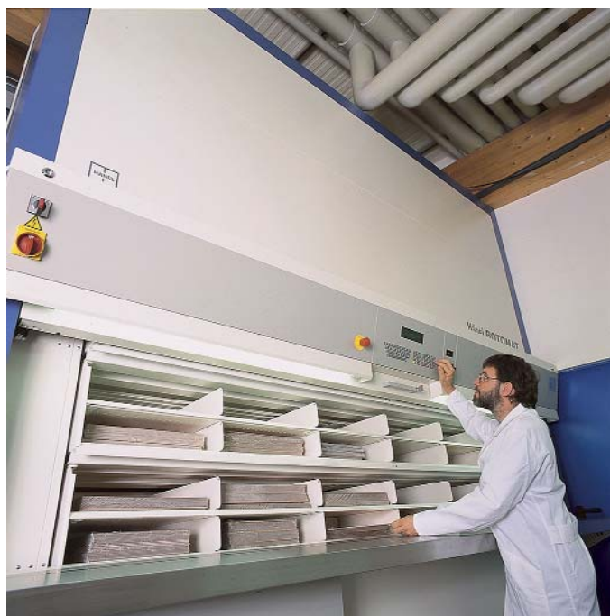
Akquisition der Häfele GmbH aus Aulendorf – inklusive Lagerübernahme bei der Becker Müller Schaltungsdruck

Autor: Volker Feyerabend, APROS Int. Consulting & Services, www.APROS-Consulting.com